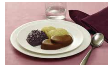
Püree-Menüs bei Kaubeschwerden.

Möchten Sie mehr über unsere neuen Menüs und Preise wissen? Wir beraten Sie gerne! Telefon: 030 / 600 300 400