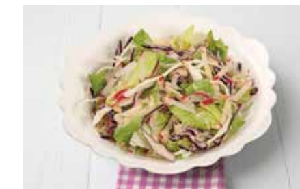
Salate runden das Angebot ab.