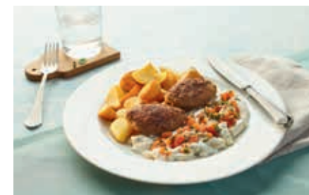
Mehr Auswahl durch 60 neue Menüs.

Ganz gleich, ob Sie es lieber deftig mögen oder die leichte Küche bevorzugen, für jeden ist etwas bei unserem erweiterten Angebot dabei. • Seelachsfilet in mediterraner Tomatensoße mit Grill-Gemüse und Kartoffelwürfeln • Gepökelter Schinkenbraten in Soße mit Wirsing und Salzkartoffeln